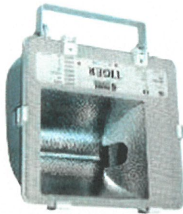
POHĽAD NA SVIETIDLO