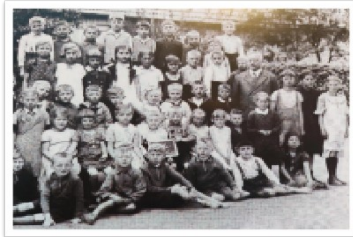
Jedna z klas w Gałęzinowie

Z marca 1845 roku pochodzi informacja o tym, że nauczyciel Glaubecke, dotychczas zatrudniony na próbę odtąd zostaje zatrudniony na stałe. Urząd nauczyciela sprawował tu do 1851 roku i dostawał 45 talarów czyli po jednym schlugeldu rocznie od każdego ucznia. Niestety, ale w tamtych czasach nie było jeszcze autobusów, więc wymyślono, aby dzieci jeździły powozem konnym do szkoły i ze szkoły.