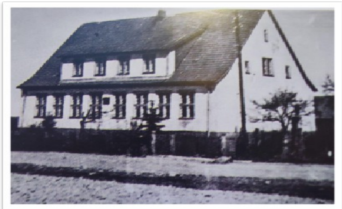
Szkoła w Gałęzinowie po wojnie