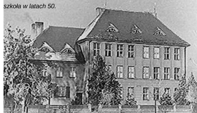
szkoła w latach 50.

techniczny spowodował, że władze zaborcze, które w okresie Kulturkampfu podporządkowały sobie szkolnictwo, podjęły decyzję o budowie nowego obiektu, który otwarto 17 sierpnia 1914r.