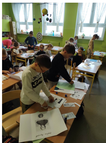
Jedna z lekcji