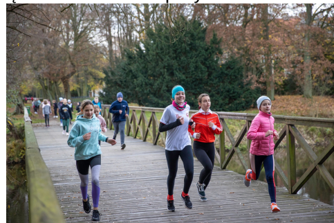
Bieg w 50-ę