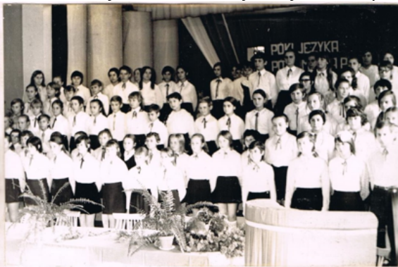
Świeży i ambitny program o mowie polskiej, o języku ojczystym