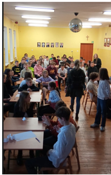
Konkurs wiedzy o języku i Patronie