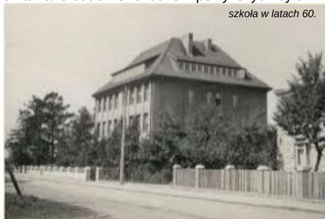
szkoła w latach 60.

zwiększenie ilości sal lekcyjnych z pierwotnych 7 do obecnych 19 oraz Izby Tradycji, sekretariatu, gabinetów dyrektora, psychologa, pedagoga, logopedy, pielęgniarki, auli, biblioteki, świetlicy, pracowni językowej, komputerowej, kuchni, stołówki oraz magazynu. Budynek przestał pełnić funkcje mieszkalne dla pracowników. W 1993r. Zaprzestano wykorzystywania piwnic jako kuchni, stołówki i świetlicy. W tym samym roku zajęcia wychowania fizycznego dotychczas odbywające się pod dachem w obecnej restauracji Wielkopolska lub na korytarzach szkoły zostały przeniesione do sali gimnastycznej budynku, gdzie siedzibę mają m.in. przedszkole i OSP. Wybudowana w 2019r. hala sportowa