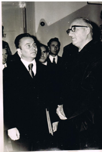
Zgłoszenie od dyrekcji Kombinatu PGR - Złotowo oświadczenie dyrektora im. Kopczyńskiego z-ca dyrektora / w okolicznościach /