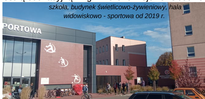
szkoła, budynek świetlicowo-żywieniowy, hala widowiskowo - sportowa od 2019 r.