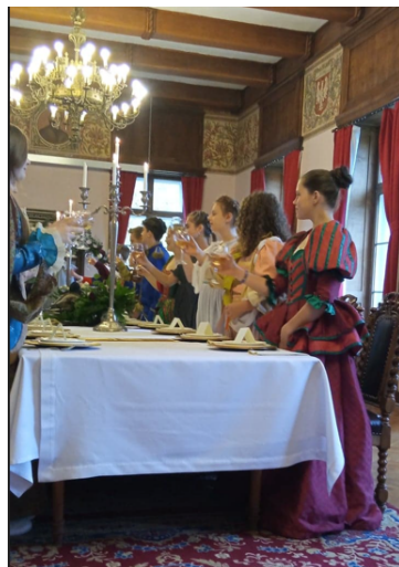
Rekonstrukcja w pałacu