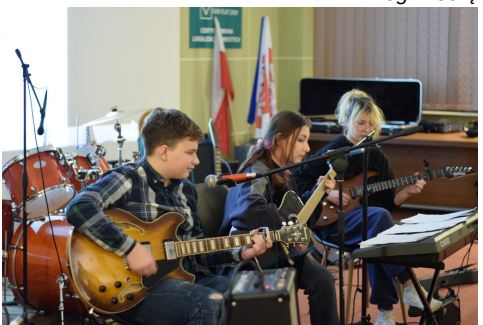
„Spod skrzydeł Onufrego”