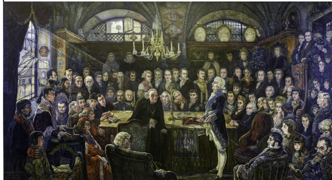
Obraz z 1916r.

w Warszawie. W czasie wojny ukryty przed hitlerowcami przeleżał w podziemiach Muzeum