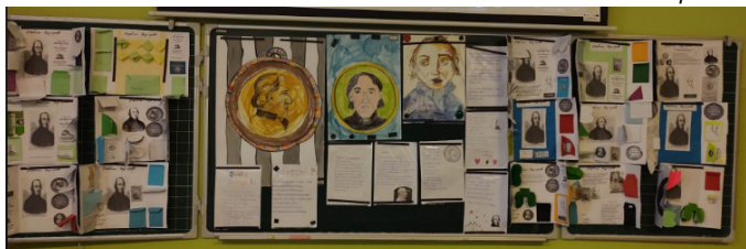
i wiersze, obrazy...