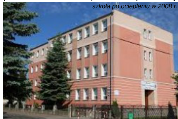
szkoła po ociepleniu w 2008 r.