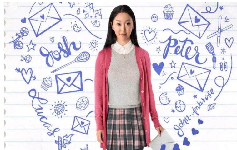
Do wszystkich chłopców, których kochałam

Uwielbiamy wzruszać się wraz z bohaterami, a także cierpieć z nimi, czy przeżywać chwile radości. Fabuła głównie opowiada o zakochanej Elle w bracie jej przyjaciela. Jednak to nie jest takie proste. Ponieważ...? Jak ona i Lee byli mali, napisali zasady i jedną z nich było, że związki w rodzinie są nieosiągalne, dlatego też Elle ukrywała swoje uczucia do Noah, ale sama do końca nie była na samym początku chyba przekonana, że zakochała się w nim.