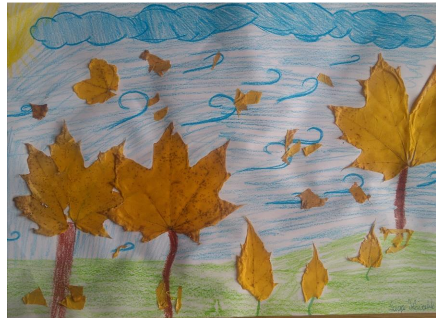
wyk. Łucja Kowalik kl. V