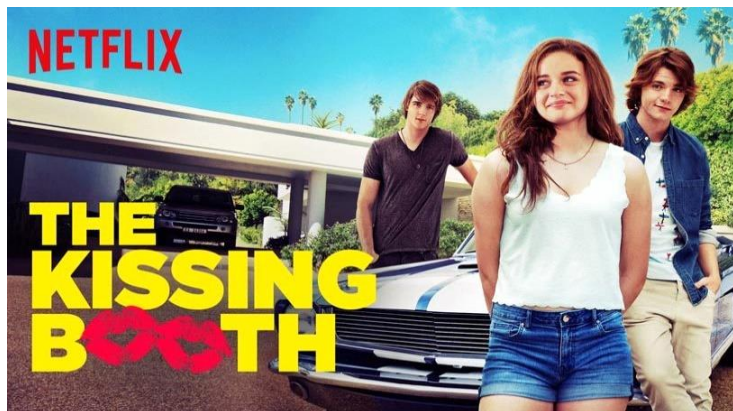
The Kissing Booth

Każdy z nas ma taki dzień, kiedy chce przeczytać coś lekkiego. Najczęściej sięgamy wtedy po romanse bądź młodzieżówki, w których nie porusza się zbyt wielu trudnych wątków. Jedną z takich pozycji jest The Kissing Booth . Wzloty i upadki par to coś, co lubimy śledzić, dlatego, że bardzo często szukamy w takich historiach odzwierciedlenia własnych przeżyć.