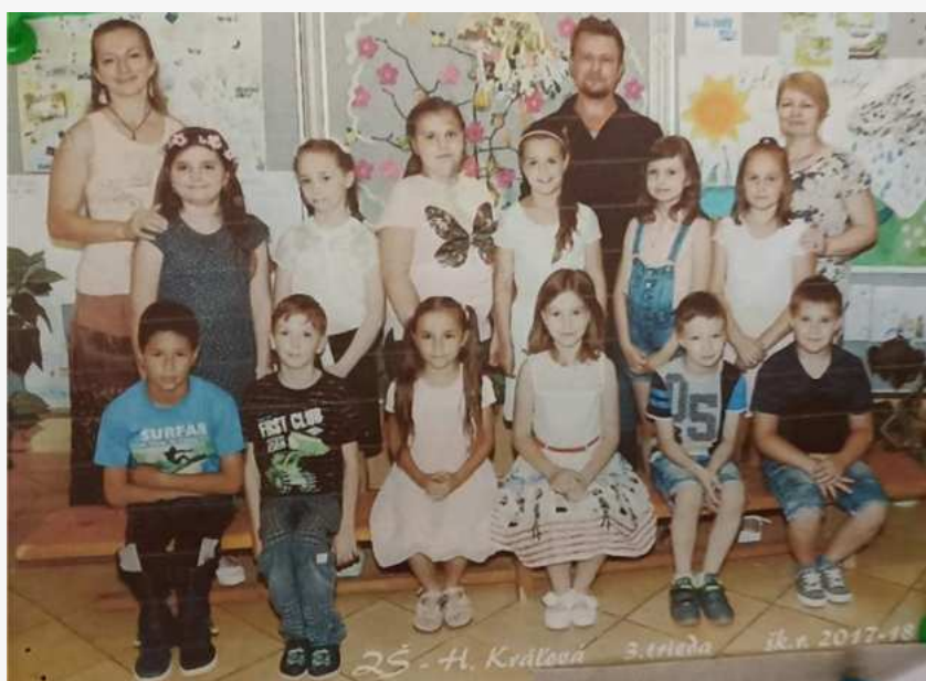
ZŠ - H. Kráľová 3.trieda šk.r.2017-18