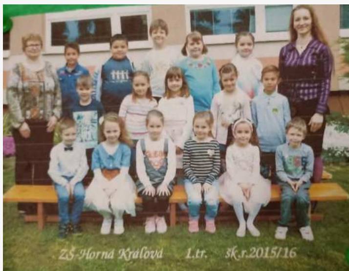
ZŠ Horná Kráľová 1.tr. šk.r.2015/16