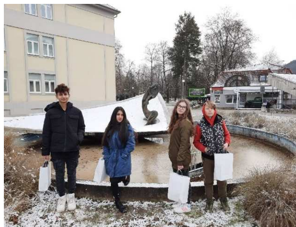
na ceste späť do školy