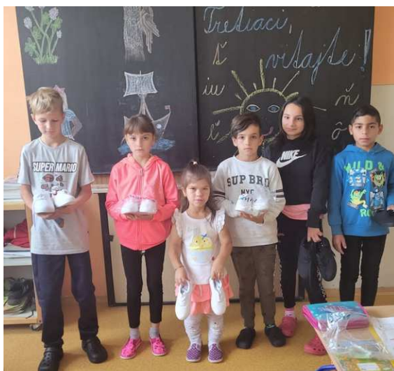
žiaci z 3.A