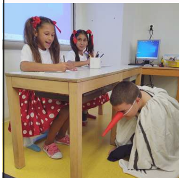
žiaci z 2.A

Každý štvrtý októbrový pondelok si pripomíname Medzinárodný deň školských knižníc. Pri tejto príležitosti sa naša škola opäť zapojila do súťaže o najzaujímavejšie podujatie školskej knižnice, s cieľom podporiť u žiakov dobrý, trvalý vzťah ku knihe, k čítaniu a poznávaniu nového.