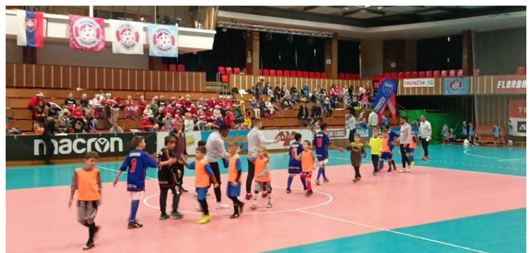
zvítanie sa s protihráčmi