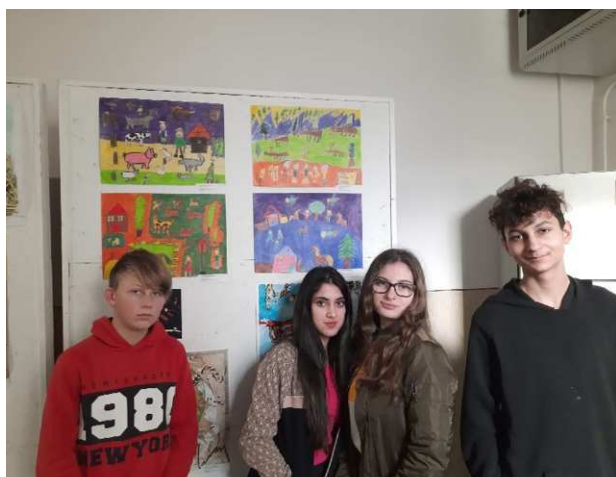
žiaci so svojimi výtvarnými prácami