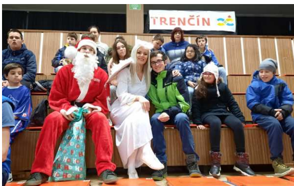
fanúšikovia z Prš, PT3, PT4 a 5.A