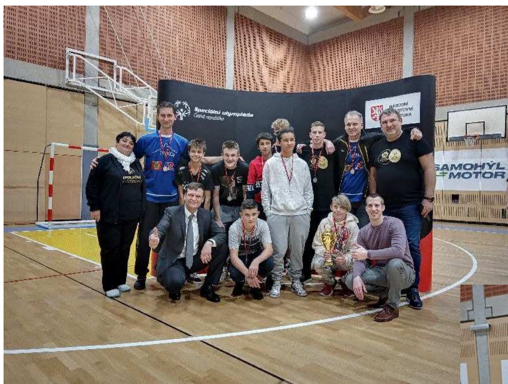
náš hviezdny tím

chybu v obrane a vsietil úvodný gól. Keďže domáci reprezentanti zo Zlína boli veľmi dobre takticky a vytrvalo pripravení a dlhodobo spolu trénujú, ich vysnivanú cestu do Berlína sme im vo finálovom zápase nepoškvrnili ani my a zaslúžene získali pohár pre víťaza. Naši chlapci skončili na 2. mieste. Po zápase boli veľmi sklamaní, ale nakoniec sme sa tešili z umiestnenia ale i ostatných zážitkov. Reprezentantom ďakujeme za zviditeľnenie svojej školy, mesta Trenčín ale i rodného Slovenska. Želáme im, aby nadobudnuté skúsenosti zúročili v športovom a osobnom živote.