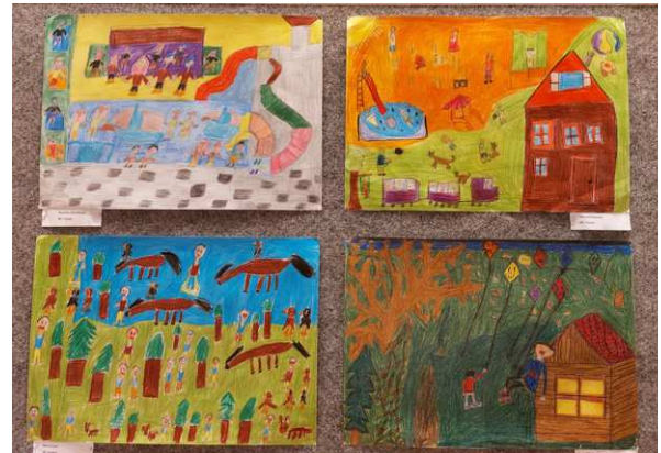
výtvarné práce našich žiakov