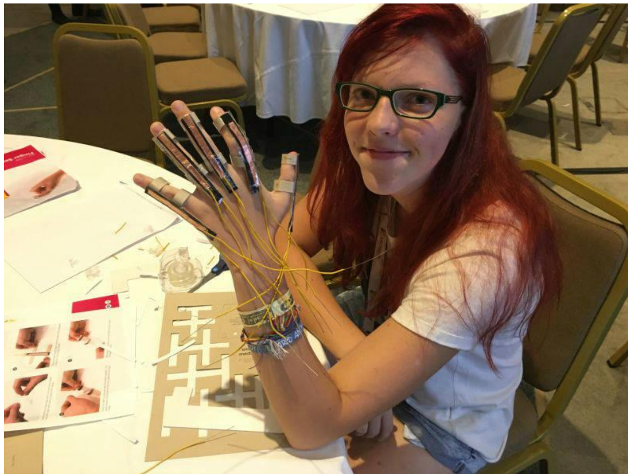
V projekte robotickej ruky Bootcamp Atény