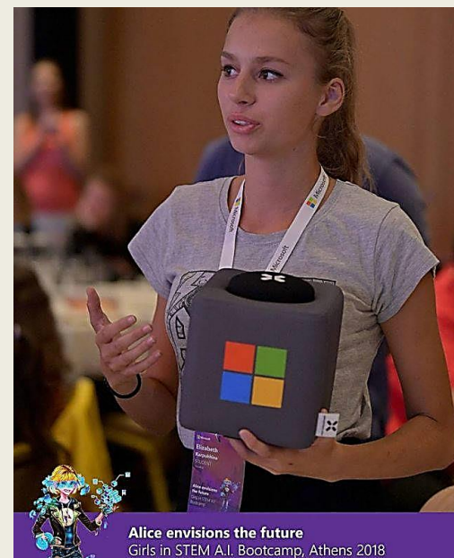
Alice envisions the future Girls in STEM A.I. Bootcamp, Athens 2018

Aktívna participácia na tvorbe portálu Učíme na diaľku a sociálnych sietí Učíme na diaľku. Za túto aktivitu získala ocenenie riaditeľky Štátneho pedagogického ústavu v Bratislave.