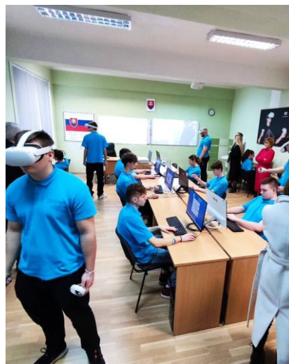
Prípravila: Mgr. Martina Derdziaková