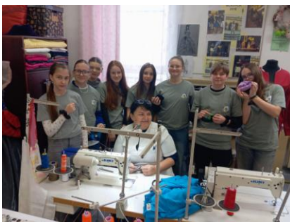
Prípravila: Mgr. Martina Derdziaková