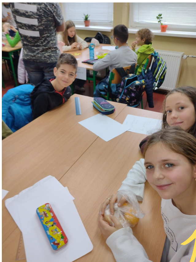
8. miesto Liga 4x4 1.miesto matematický kufor