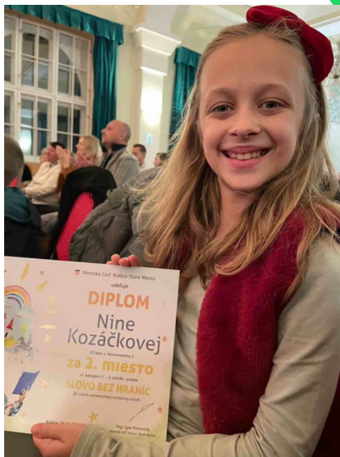
2. miesto Slovo bez hraníc