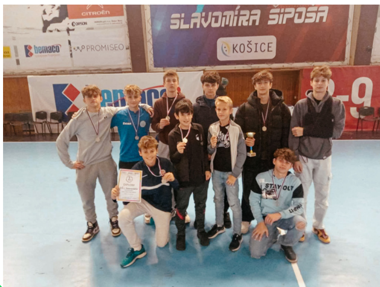
2. miesto okresné kolo florbal žiakov