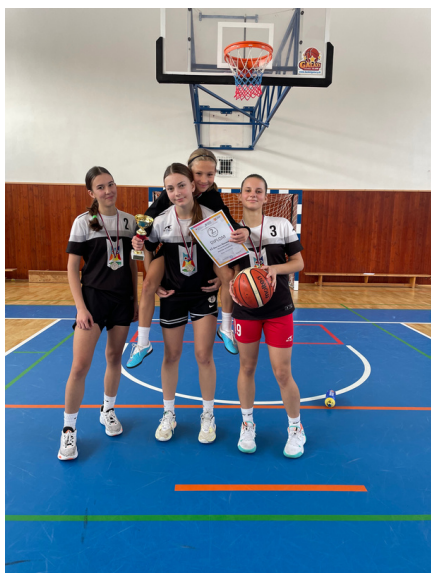
2. miesto okresné kolo 3x3 streetbasket dievčat