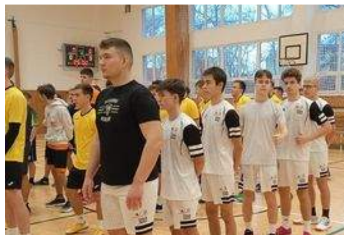
Okresné kolo v basketbale