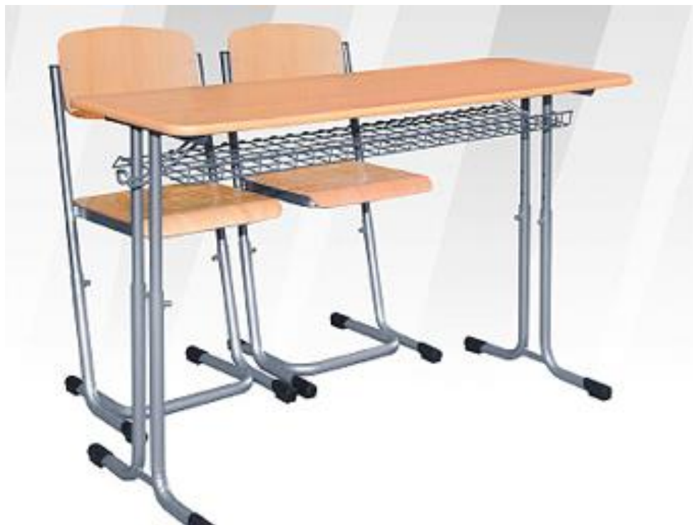
OBRÁZOK - ILUSTRÁČNÝ OBRÁZOK OBJEDNANÉHO NÁBYTKU

V triedach strednej školy sa nám podarilo vymeniť starý a opotrebovaný nábytok za nový a vzhľadovo modernejší. Triedy tak získali modernejší vzhľad a zároveň pre každého žiaka v príslušných triedach bolo vytvorené vlastné pracovné miesto.